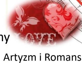
Artyzm i Romans

Północny wschód: Tu romansujemy lub tworzymy. Remontujemy i planujemy siewy w ogrodzie. Remedium: dodaj więcej czerwieni wokół, pal świece i kadzidełka.