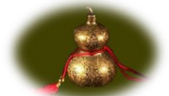
Przeszkody i Choroby

Zachód: uważamy na włamania i kradzieże. Remedium: dodajemy czerwieni i palimy świece.