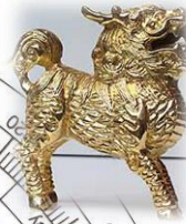
Plotki i szkody