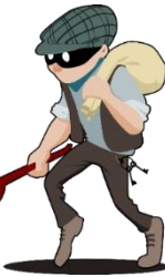
Kradzież i straty

Zachód: uważamy na włamania i kradzieże. Remedium: dodajemy czerwieni i palimy świece.