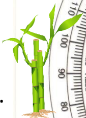
Plotki i szkody