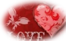
Artyzm i Romans

Północ: wypadki, choroby nerek. Remedium: 9 kul złotych i 4 srebrne w czerwonej miseczce i zegar pradziadka. Do tego muzyka grana na pianinie lub gitarze.