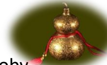
Przeszkody i Choroby

Zachód: blokady, opóźnienia, choroby, Remedium: tykwa kalabasz.