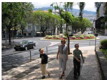
Przykład wprowadzenia zieleni do miasta. (Funchal – Madera)

potrzebują więcej Jang i im właściwie nie przeszkadza sypialnia w centrum miasta, to jednak zasadniczo te funkcje raczej się wykluczają i dlatego musimy poszukać rozsądnego kompromisu. Tak więc w otoczeniu silnie Jang potrzeba jednak nieco energii Jin, aby wprowadzić element spokoju i spowolnić tempo życia. Ważną sprawą jest tu zadbanie o tereny zielone w centrum miasta i niestety – według Feng Shui – ogrody urządzone na dachach nie są najlepszym rozwiązaniem (za wyjątkiem małych pojemnikowych upraw na tarasach).