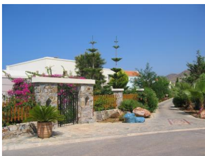
Przykład osiedla podmiejskiego. (Kreta - Grecja)

większości przypadków spotykamy się z sytuacją już zastaną – na przykład stare osiedla czy osady, ale czasem mamy szansę zaprojektować większy kompleks mieszkalny łącznie z otaczającą go strefą rekreacyjną; jest to jednak proces bardzo złożony (choć w ostatecznym rozrachunku okaże się, jak wiele możemy zyskać).