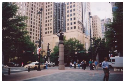
Przykład zieleni w mieście (Charlotte – USA)

Życie w zgodzie z prawami natury oznacza, że powinniśmy w naszych działaniach odzwierciedlać idee zaobserwowane w tejże naturze, a spory świerk rosnący na dachu dziesięciopiętrowego budynku (przykład teoretyczny) na pewno nie jest czymś na co dzień spotykanym w przyrodzie. Oczywiście drzewu nie zaszkodzi ta wysokość, ponieważ dla świerka jest to naturalne, natomiast będzie to w sprzeczności z zakodowanym w podświadomości każdego z nas pojęciem tego