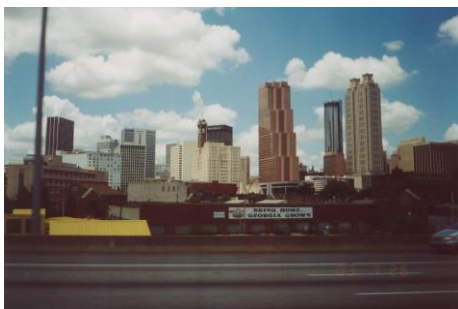
Typowy krajobraz wielkomiejski (Charlotte – USA)

Jednak część z nas musi również w tym samym krajobrazie mieszkać i wypoczywać. I choć istnieją ludzie o pewnym typie temperamentu, którzy